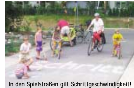
In den Spielstraßen gilt Schrittgeschwindigkeit!

Ohne eigenes Auto leben und trotzdem jederzeit auf ein Kraftfahrzeug zugreifen: Car-Sharing macht's möglich. Mitte 2003 standen bereits 12 Fahrzeuge des Car-Sharing Verbunds Südbaden in Vauban zur Verfügung, vom Kleinwagen bis zum Transporter. Bis 2006 sollen voraussichtlich 8 weitere Fahrzeuge hinzukommen. Die Fahrzeuge stehen an der Solargarage, der Villaban und der Vaubanallee (2. BA). Außerdem steht Zubehör wie Kindersitze, Dachgepäckträger, Fahrradträger etc. zur Verfügung. Die Mitgliedschaft kostet monatlich EUR 4,- für Einzelpersonen und 7,- für Haushalte (+ EUR 40,- Aufnahmegebühr + EUR 350,- bzw. 600,- Kautions). Mitglieder reservieren die Fahrzeuge telefonisch über eine laufend besetzte Buchungszentrale. In der Geschäftsstelle im mobile am Hauptbahnhof (Wentzingerstr. 15, 0761-23020) sowie unter www.carsharing-suedbaden.de gibt's weitere Informationen. Daneben haben sich im Quartier auch Haushalte zusammen getan, um privat Autos zu „sharen“. Über die dabei zu beachtenden Regeln informiert der ->Verein für autofreies Wohnen.